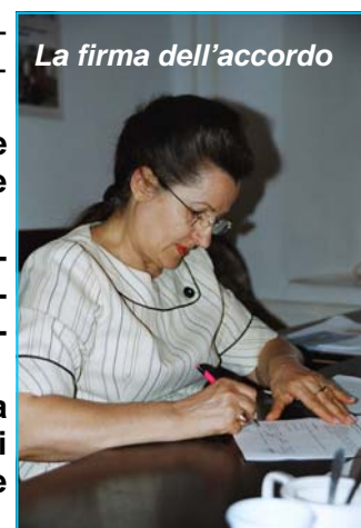
La firma dell’accordo

Il costo annuale per poter consentire il rientro di un minore in famiglia è di circa 500 euro.