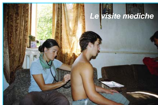
Le visite mediche