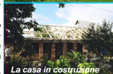
La casa in costruzione